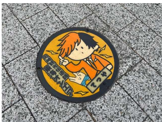
図3 東海オンエアマンホール 岡崎市現地にて (2022年12月1日)

表が東海オンエアマンホールで、これは新たな観光スポットの一つとして設置したもので、その製作費は4,348,740円であり、市の予算から支出されている(岡崎市2021c)。これらから岡崎市は東海オンエアの聖地巡礼の効果を理解して、観光客への情報の提供と交通機関などの整備をして、観光客へ聖地巡礼の便宜さを図るだけでなく、自らもマンホールといったインフラ整備をし、聖地巡礼のスポットを創り出して、一層の集客効果と観光客の満足感を高める政策を行っていることがわかる。