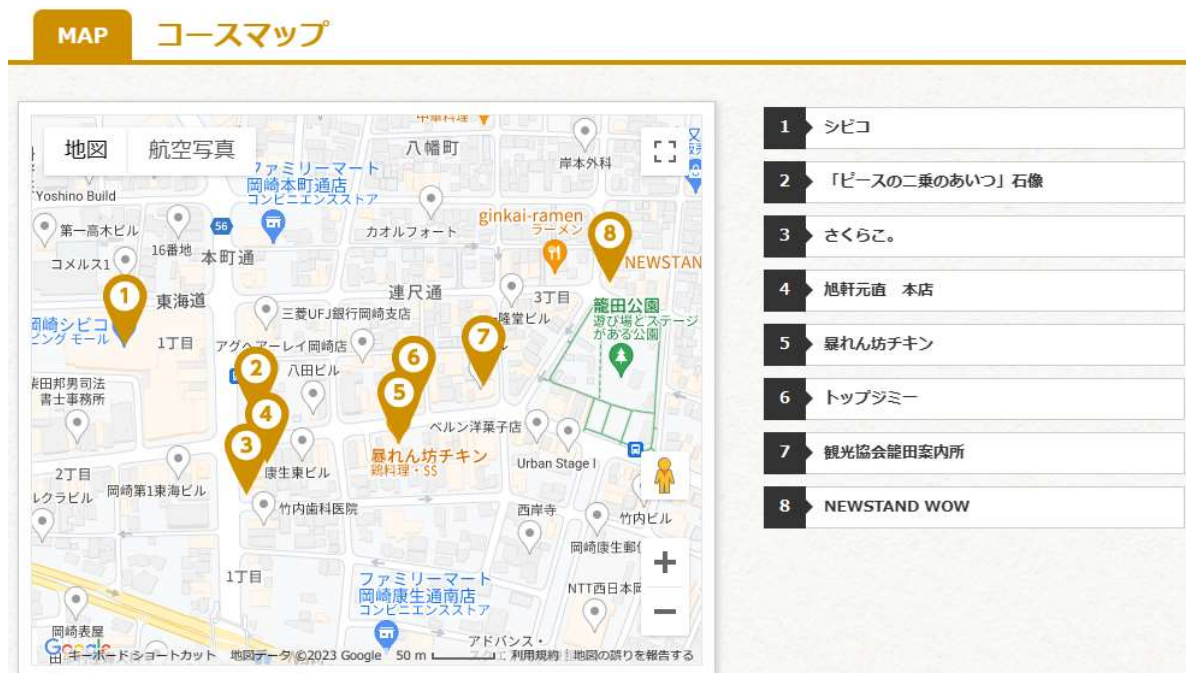
図3 「東海オンエア聖地巡り・街中パーク&ウォーク編」 コースマップ 愛知県岡崎市公式観光サイト(2023)

表が東海オンエアマンホールで、これは新たな観光スポットの一つとして設置したもので、その製作費は4,348,740円であり、市の予算から支出されている(岡崎市2021c)。これらから岡崎市は東海オンエアの聖地巡礼の効果を理解して、観光客への情報の提供と交通機関などの整備をして、観光客へ聖地巡礼の便宜さを図るだけでなく、自らもマンホールといったインフラ整備をし、聖地巡礼のスポットを創り出して、一層の集客効果と観光客の満足感を高める政策を行っていることがわかる。