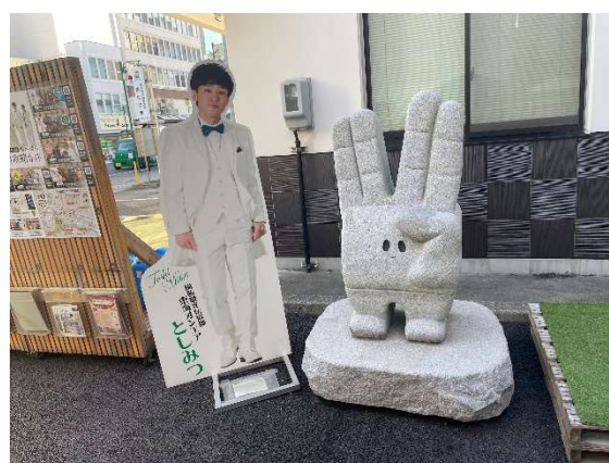
図4 等身パネル・東海オンエアマスコット キャラの石像岡崎市現地にて筆者撮影 (2022年12月1日)