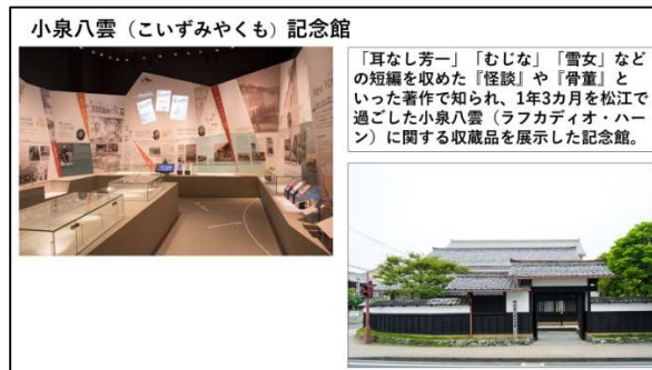
図7 観光資源 小泉八雲 記念館