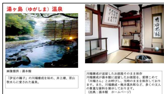
図1 観光資源 湯ヶ島温泉