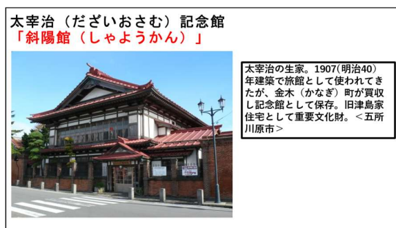
図3 観光資源 斜陽館

スライドにて斜陽館と太宰治について説明 (図3) および (図4)、「人間失格」について新潮社文庫の紹介文にて簡単に紹介 (図5)、映画「太宰治と三人の女」を説明。その後、映画「太宰治と三人の女」映画予告編 視聴した。